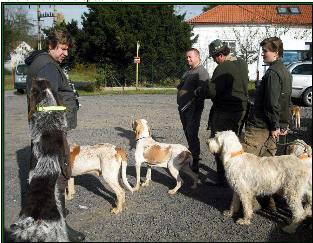
Pohár Sv.Huberta Konopiště 2009