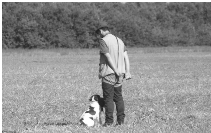
Grannus z Taranky (EB)