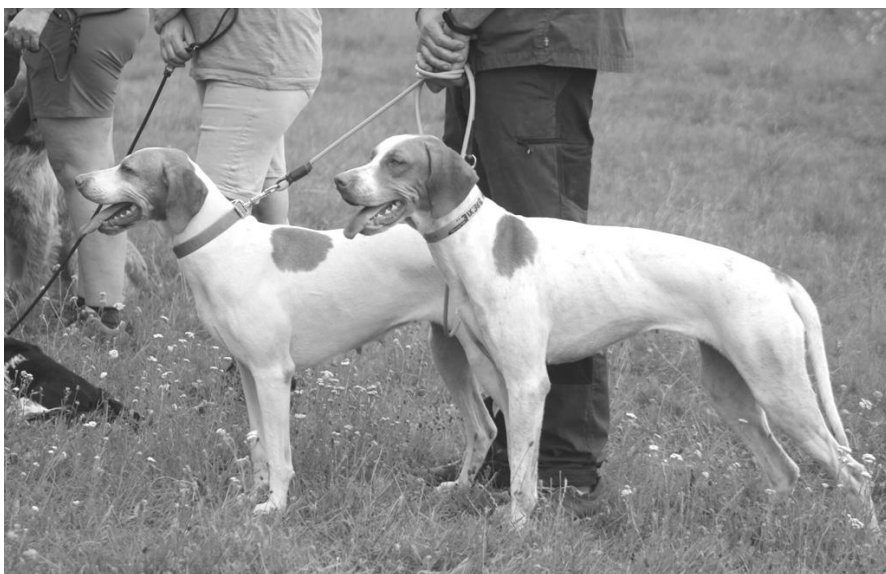
Amareta a Brixie Speedy Arrows (SGO)

Kompletní výsledková listina je na klubovém webu.