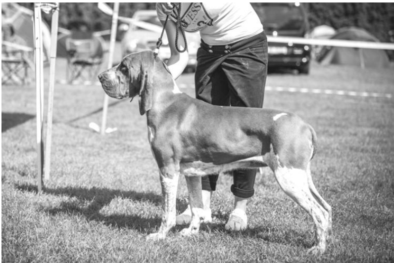
Abbie Z Hýskovy Fořtovny (IO)