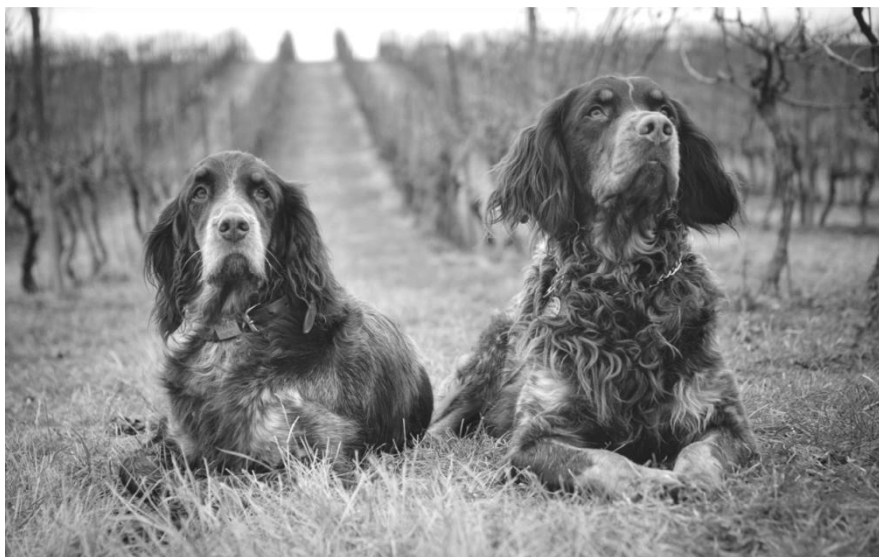
Aurora a Durrell Spanilá Jolanta (PDO)