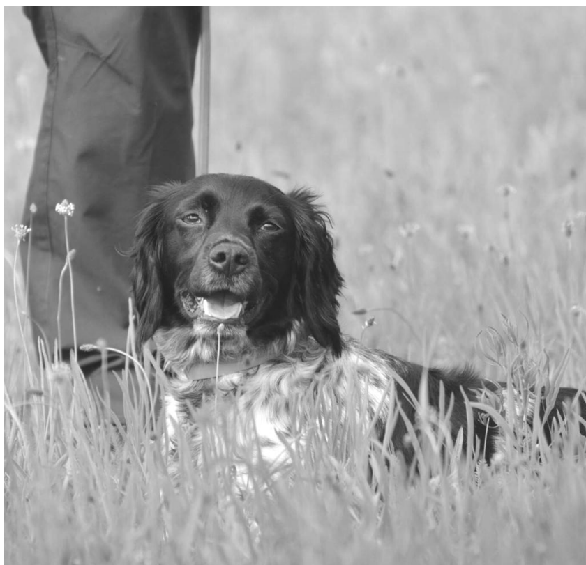
Elbrus Furbel céleste (EB)