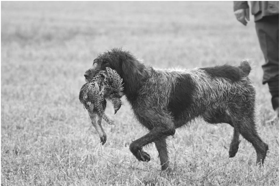
Grifon Korthalsův - Brownie Souchov

Je třeba se zmínit i o velkém nárůstu zápisů u plemene Korthalsův grifon, který docílil 1210 zápisů a to je nárůst o 21%, a u plavého bretaňského baseta bylo 995 zápisů, to je nárůst o 23%.