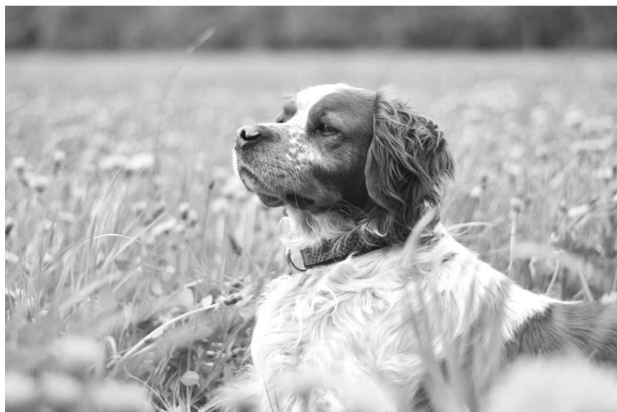
Corbenik z Taranky (EB)